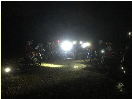
Reconnaissance du circuit avec les ados